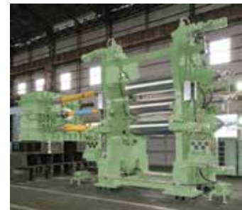
φ24"×L68" 傾斜型3本カレンダー