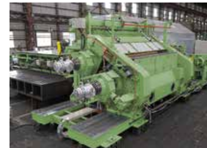
ガスケットシート製造用カレンダー