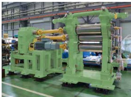
φ12" 傾斜型3本カレンダー