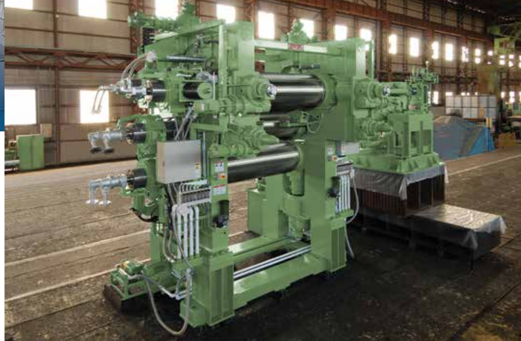
φ22"×L66" 逆L型4本カレンダー